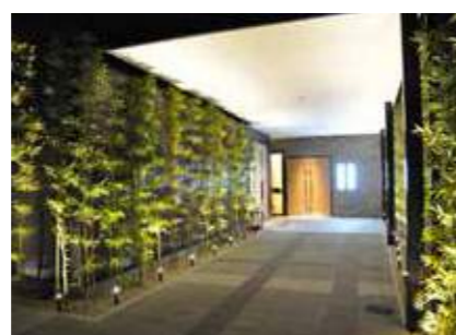
ファミリー葬 和泉 和泉市府中町3-16-21