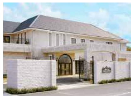
メモリアルハウス ささやま 丹波篠山市西吹577-5