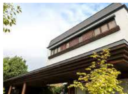
メモリアルハウス三田 四季の庭 三田市対中町2-17