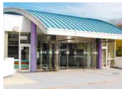
メモリアルホール 北六甲 神戸市北区有野中町4-3-1