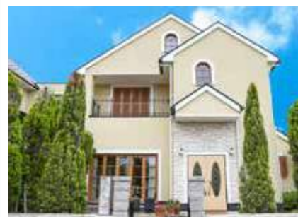
メモリアルハウス けやきの森 三田市けやき台1-4-2

自宅のような葬儀式場でアットホームな小さなお葬式。式場に隣接するリビングやダイニングキッチン、和室やバスルーム。 他にはない、まるで自宅にいるような心やすらぐ場所。家族葬専用で設計された心落ち着く空間です。