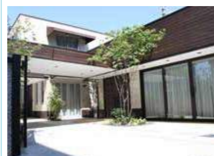
ファミリー葬 平野 大阪市平野区流町1-4-27