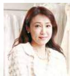
KSG group 株式会社レック 代表取締役