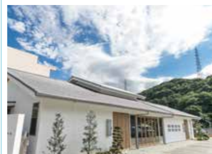
ファミリー葬 須磨 神戸市須磨区妙法寺字筆前178-2