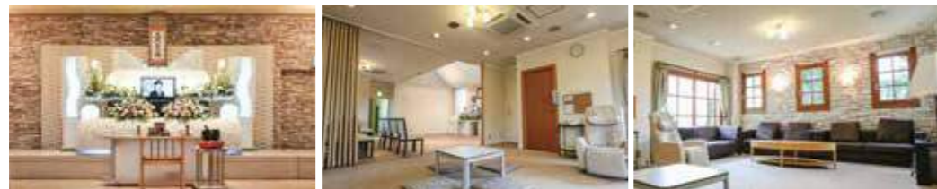
※写真は施設の一部です。

癒やし・くつろぎ・温かさ、そして、設備・儀式・サービス、すべてに心のこもったレックの家族葬プランです。 オリジナル基本祭壇にお棺、枕飾り、遺影写真や寝台車など、葬儀・葬式に必要なものをすべて含んだ安心のプランです。必要に応じてオプション品も会員価格にてお選びいただけます。