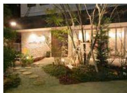
ファミリー葬 堺 堺市北区百舌鳥本町1-6-1