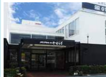
メモリアルホール やすらぎ 三田市対中町4-4