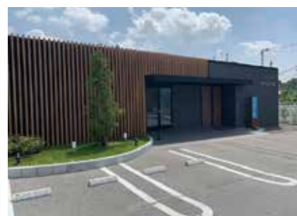
ファミリー葬 西宮名塩 西宮市塩瀬町名塩2204