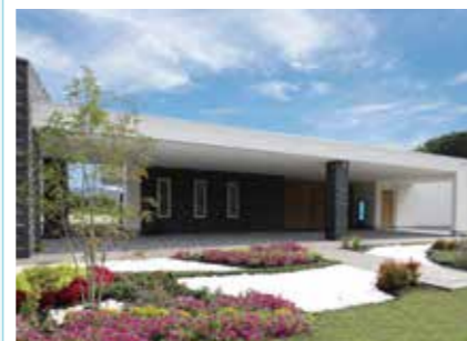
ファミリー葬 鹿の子台 神戸市北区鹿の子台南町2-12-2