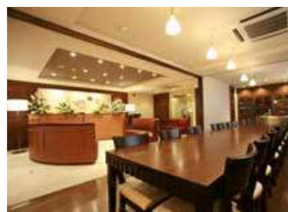
ファミリー葬 鈴蘭台 神戸市北区北五葉6-14-30